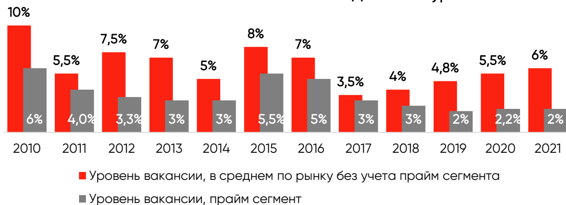
Динамика уровня вакансии

Средневзвешенный уровень вакансии на рынке торговой недвижимости Санкт-Петербурга составляет 6%. С конца 2020 уровень по рынку вырос не более 1,8 пп. Значительного оттока арендаторов не происходит.